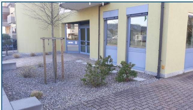
Eingangsbereich Wohngemeinschaft Marktheidenfeld